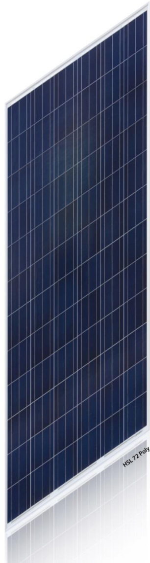
HSL 72 Poly