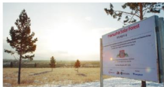
▲ 韩华新能源通过种植韩华太阳林帮助中国对抗沙漠化的进程

了一座太阳能电厂，持续为一个3200平方米的育苗温室提供所需的电力供应，进而助力中国毛乌素沙地的造林工作。